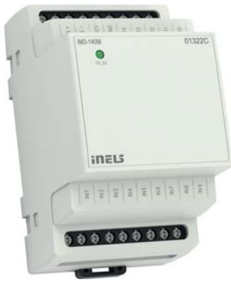
EAN kód IM3-140M: 8595188132459